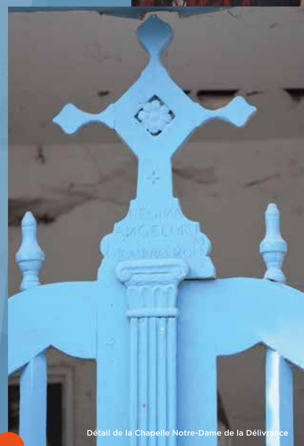
Détail de la Chapelle Notre-Dame de la Délivrance