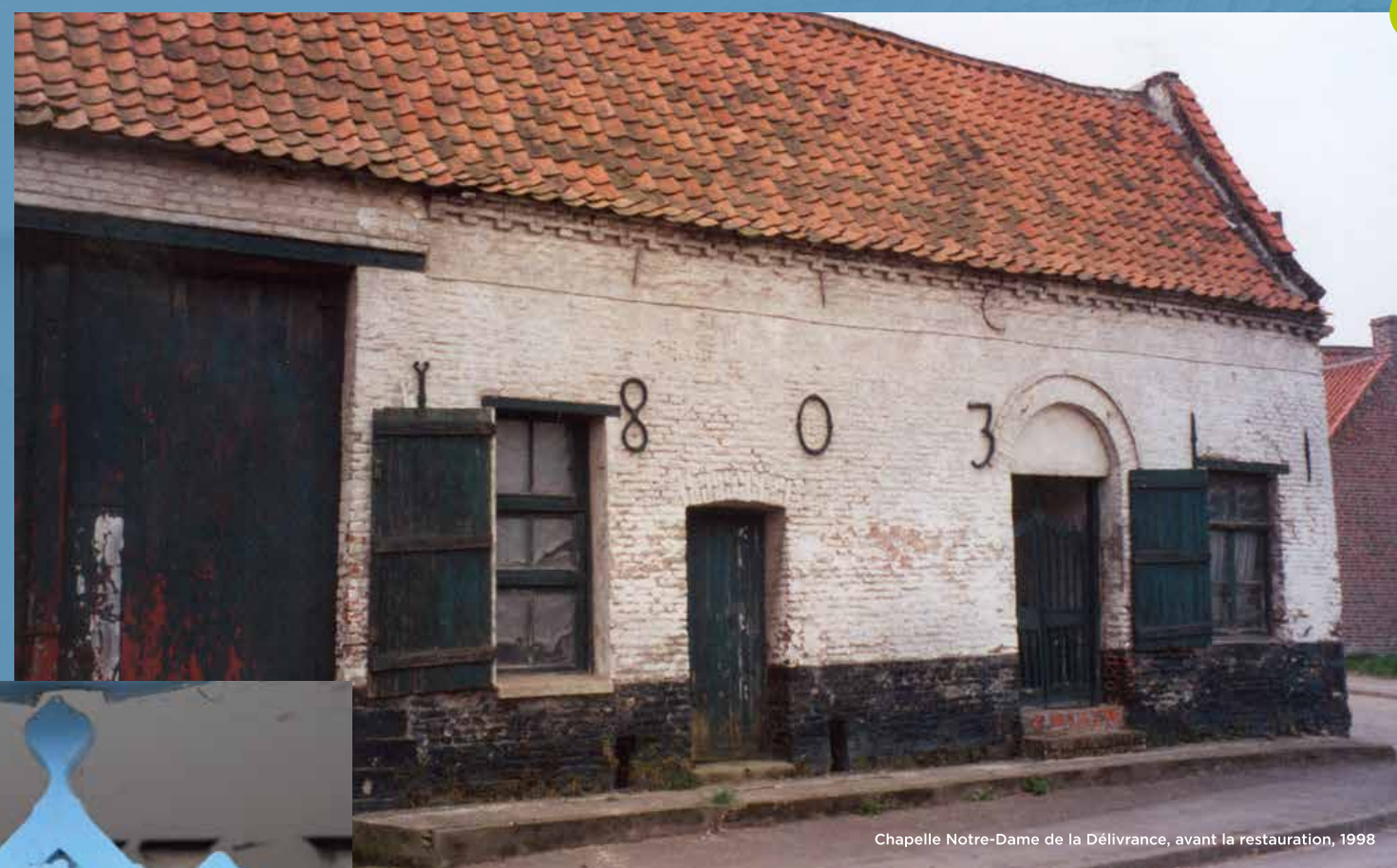
Chapelle Notre-Dame de la Délivrance, avant la restauration, 1998

On August 15, the villagers used to go on a procession to the chapel, thus celebrating the Assumption of the Virgin Mary.