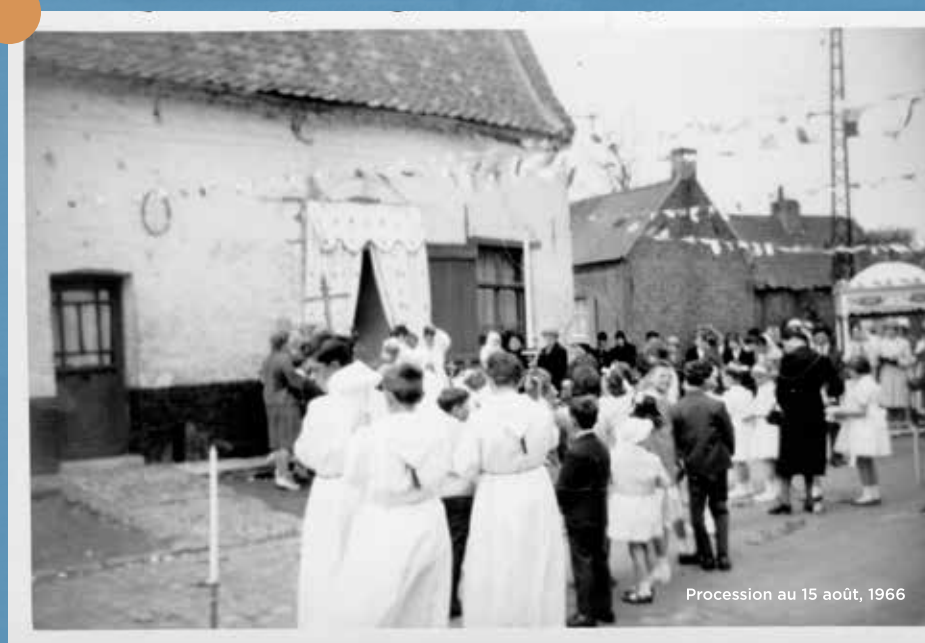
Procession au 15 août, 1966