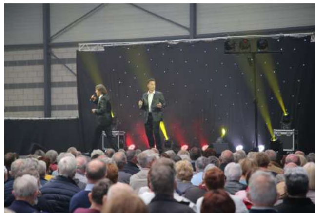
Semaine Bleue 2021