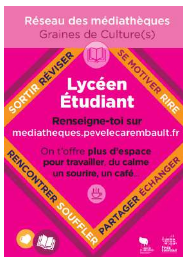
Point de rencontre pour étudiants et lycéens