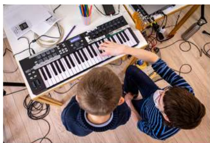
Live entre les Livres 2021