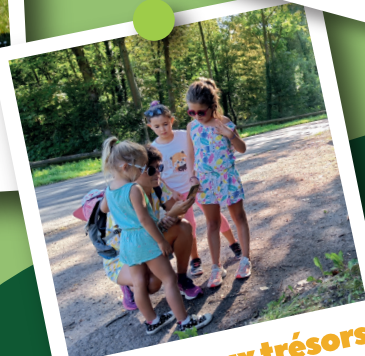
Chasses aux trésors Totemus®