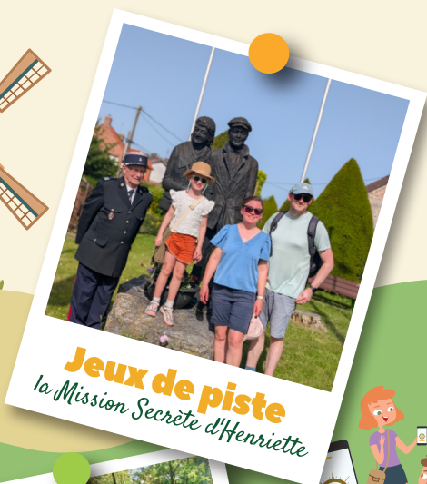
Jeux de piste la Mission Secrète d'Henriette