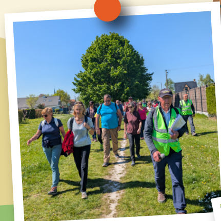
Randonnées avec les ambassadeurs