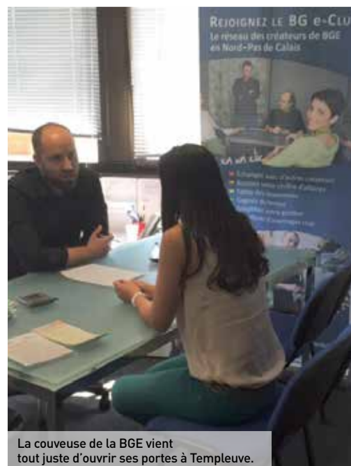
La couveuse de la BGE vient tout juste d'ouvrir ses portes à Templeuve.