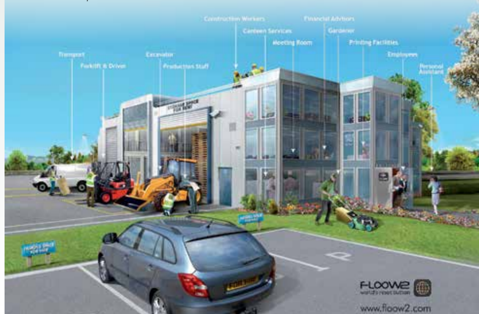
Floow2 permet aux entreprises et aux collectivités de partager des équipements, des services voire du personnel.